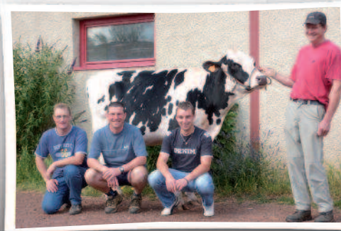
Les inséminateurs du groupe Centre Velay au GAEC DES ACHAMPS